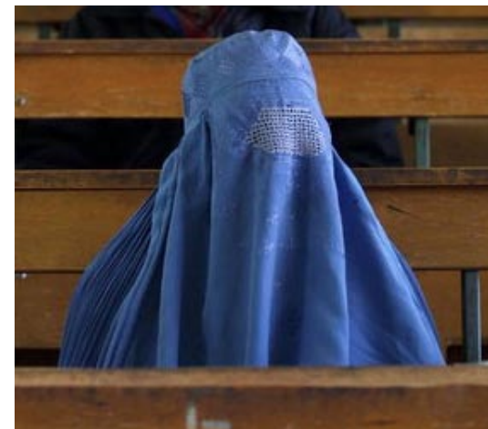
burkha - Afganistán